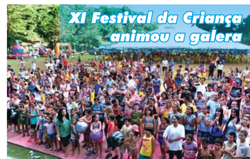
XI Festival da Criança animou a galera

A Associação Sabesp deseja a todos os seus associados, amigos e colaboradores um Feliz Natal e um 2010 repleto de felicidade.