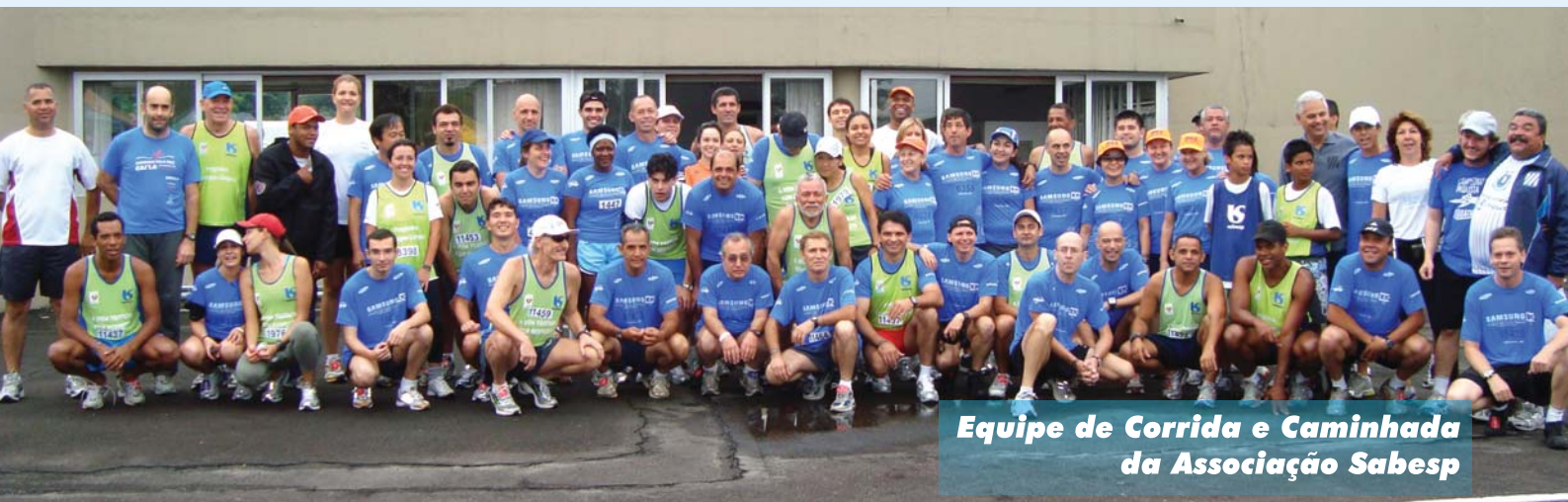
Equipe de Corrida e Caminhada da Associação Sabesp

Mais do que um evento esportivo, a corrida de rua, Samsung 10K Corpore São Paulo Classic, realizada no domingo de 22 de novembro, em São Paulo, possibilitou aos seus participantes a oportunidade de homenagear uma das grandes personalidades de nossas raízes históricas e culturais, com a disputa pelo Troféu Zumbi dos Palmares, em comemoração ao feriado da “Consciência Negra 2009”.