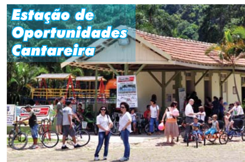
Estação de Oportunidades Cantareira