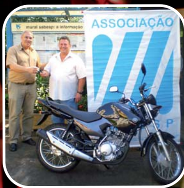
Campanha de Fidelidade 2009