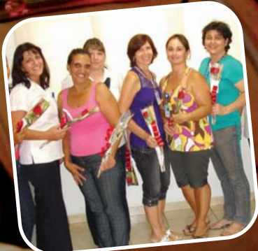
Homenagens ao Dia Internacional da Mulher