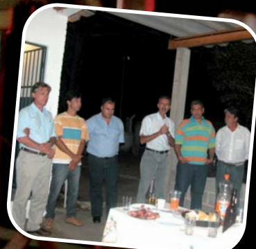
Inauguração do Departamento de Itobi