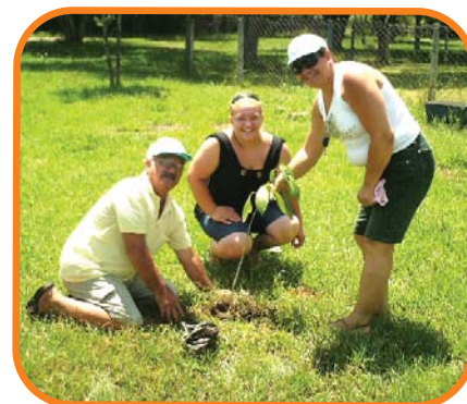
Uma das atividades foi o plantio de mudas