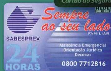
Seu antigo Cartão