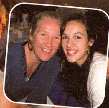
Homenagens ao Dia das Mães