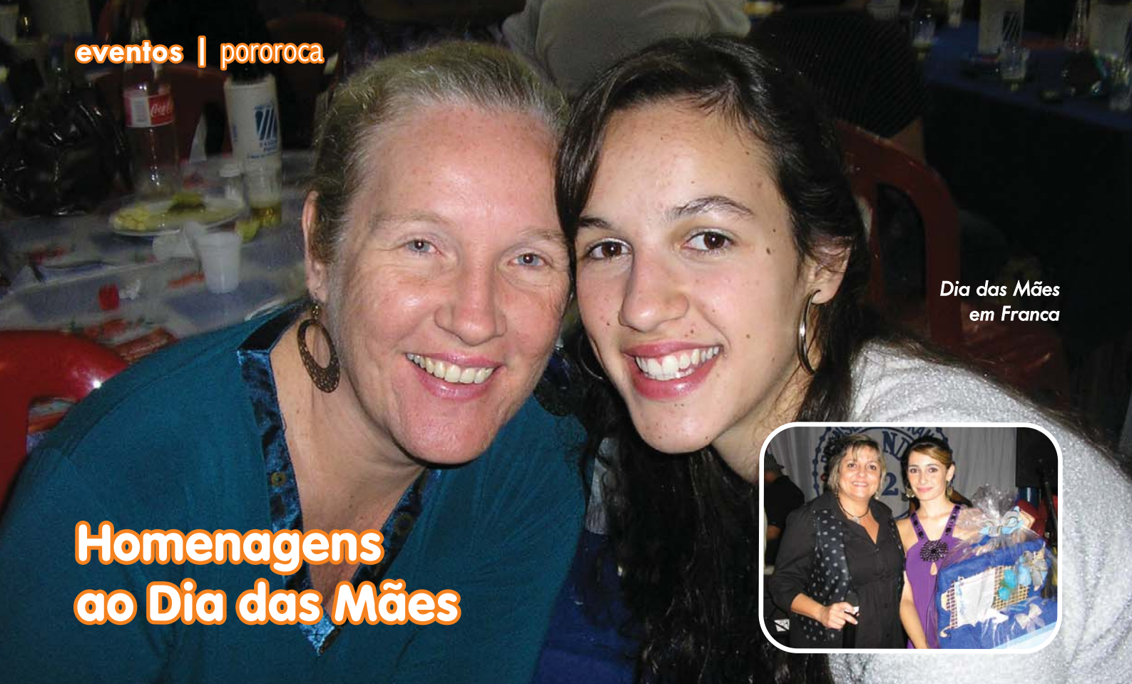
Dia das Mães em Franca