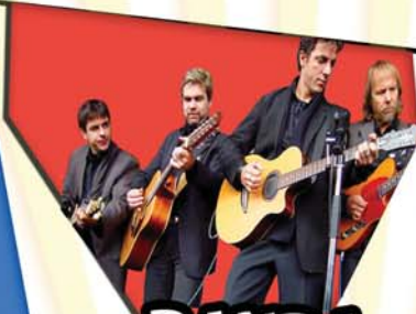
BANDA BIG VALLEY