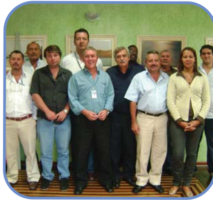
Diretoria Regional Norte

Em 2009, foram visitadas as Regionais de Botucatu, Lins, Metropolitana Norte, Metropolitana Centro e Metropolitana Oeste, nas quais o presidente discorreu sobre o planejamento estratégico da Associação como um todo e sobre a otimização de cada núcleo, destacando as suas necessidades