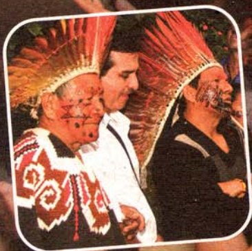
Profetores da floresta celebram o "Dia do Meio Ambiente", no Cantareira