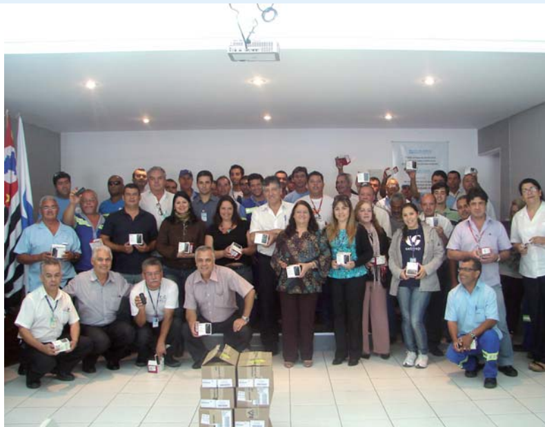
Entrega de celulares em Pindamonhangaba

A Associação Sabesp, em parceria com a OI, em comemoração ao seu aniversário de 40 anos, celebração do seu “Jubileu de Rubi”, presenteou todos os seus associados, mesmo os aposentados, com um telefone celular moderno, bonito e de alta tecnologia, que pode operar com dois chips e possui um ano de ligações ilimitadas entre esse grupo.