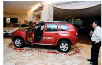
Os modernos modelos da Renault, em exposição, combinou com a cor