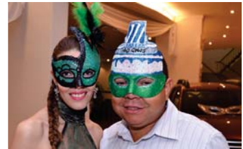
Em suas máscaras, casal presta homenagem aos 40 anos da Associação Sabesp