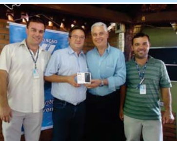
Entrega de celulares em Franca