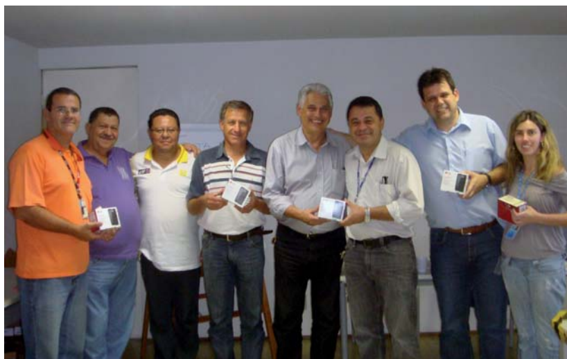
Entrega de celulares em São José dos Campos