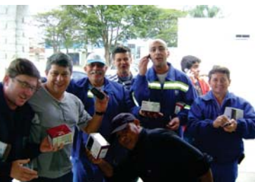
Entrega de celulares em Itapetininga

Milhares de celulares já foram nas unidades Metropolitanas e Regionais da Sabesp. Destacamos a distribuição nas cidades de Franca, Lins, São Jose dos Campos, Taubaté, Pindamonhangaba, Itapetininga, Avaré, Botucatu, Tatui, Baixada Santista - Santos, Bertioga, Cubatão, Itanhaem, Itatiba, Presidente Prudente e Tupã, além das entregas feitas na SIPAT da Metropolitana, Costa Carvalho e Ponte Pequena.///