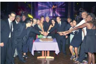
Dirigentes da Sabesp, das entidades co-irmãs e da Associação, se unem