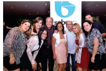
A primorosa equipe da Associação Sabesp trabalhou no