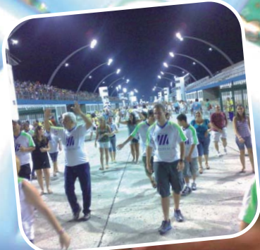
Associação Sabesp no Carnaval 2009