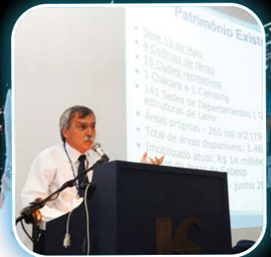
Associação na Audiência de Sustentabilidade