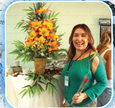
Homenagens ao Dia da Mulher