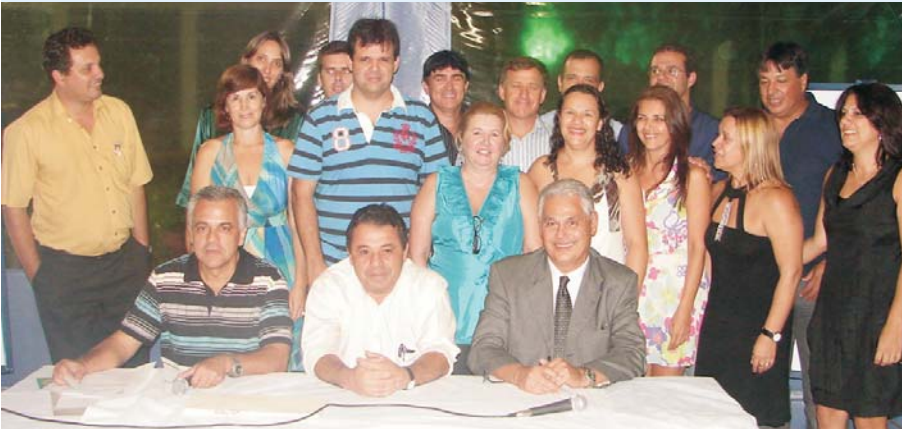
Nova Diretoria da Associação Sabesp de São José dos Campos