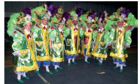
Animação total com a galera vinda de Botucatu