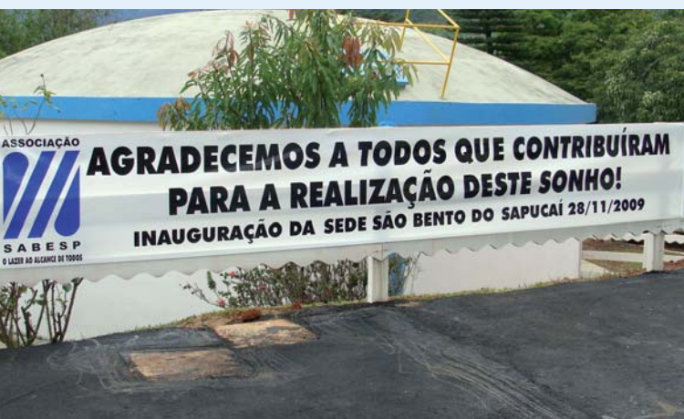
A faixa alusiva à "realização de um sonho"