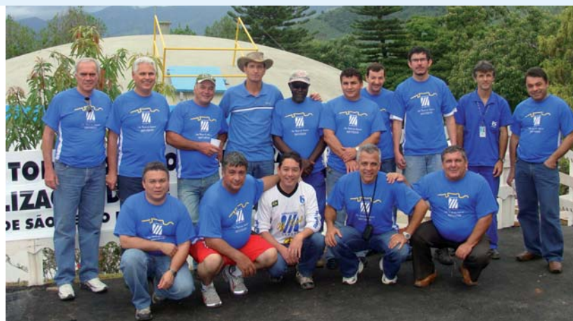
Autoridades que prestigiaram o grande evento

O sábado de 28 de novembro foi muito especial para a nova gestão "O Lazer ao Alcance de Todos", junto aos amigos da RV, pois foi inaugurada a sede da Associação Sabesp de São Bento do Sapucaí. Este novo espaço de lazer conta com uma ampla área útil integrada à ETA desta unidade.