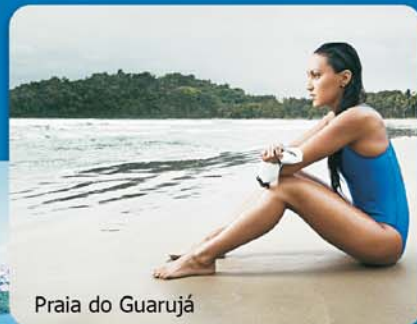
Praia do Guarujá

Poliana Okimoto Campeã mundial de maratona aquática