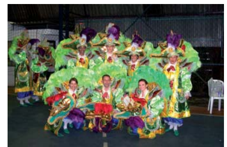
O pessoal da Metropolitana também marcou presença