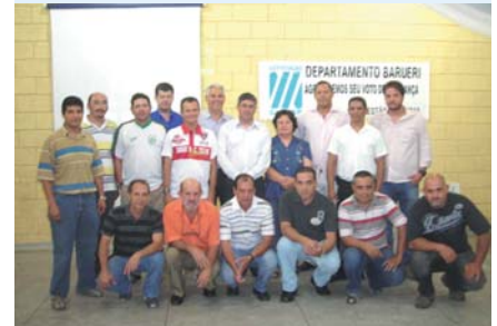
Nova Diretoria da Associação Sabesp de Barueri