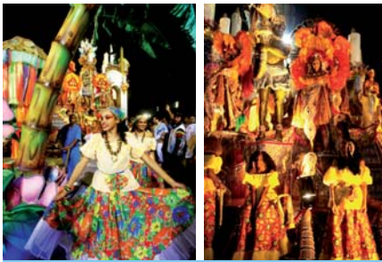
Desfile da Acadêmicos do Tucuruvi

A Associação Sabesp promoveu a participação de seus associados no principal cenário do Carnaval paulista: o desfile das Escolas de Samba no Grupo I, com a participação de cerca de 200 integrantes na “Acadêmicos do Tucuruvi”, na sexta-feira, dia 12, além de um grupo participante na “Tom Maior”, no sábado, dia 13.