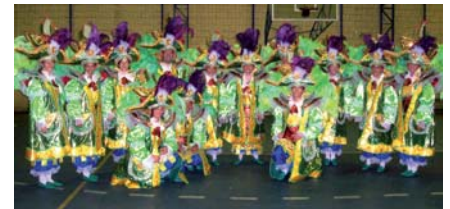
Grande grupo vindo de São José dos Campos