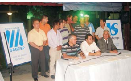
Campos do Jordão