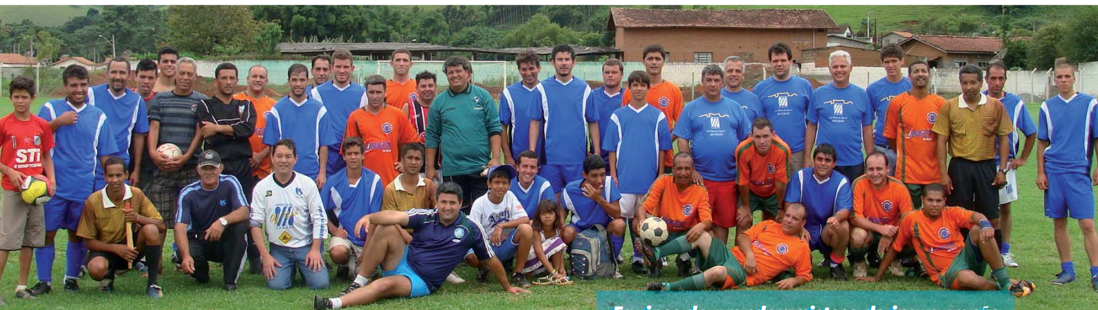
Equipes do grande amistoso de inauguração