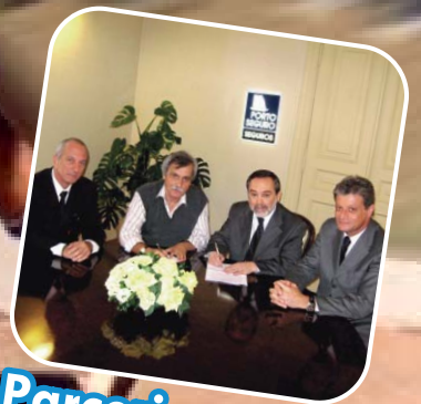
Parceria com a Porto Seguro