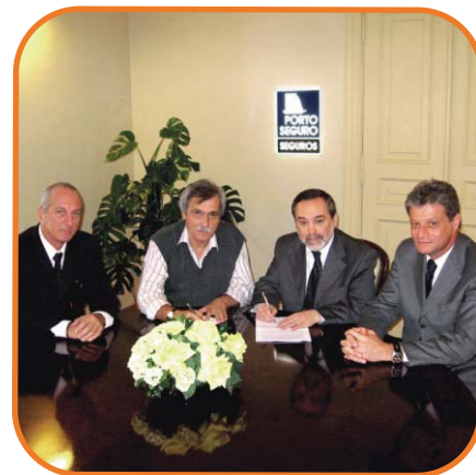
Assinatura do contrato da parceria entre a Associação, SK Seguros e a Porto Seguro

As condições diferenciadas podem ser consultadas diretamente com a SK Corretora pelo telefone (11) 3366-1110. 🔥