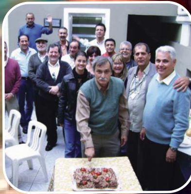
35 Anos de Associação Sabesp