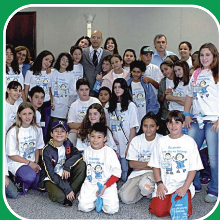
Sabesp prepara jovens para consciência ambiental

J ovens de 7 a 11 anos, filhos de empregados da Sabesp, no mês de Julho, se dividiram em turmas para um programa muito interessante: conhecer a empresa em que os pais trabalham e ver o