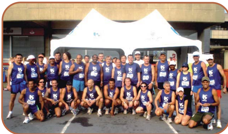
A grande equipe da corrida

No local do evento foi montada uma Barraca