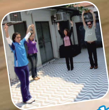
Programa de Qualidade de Vida