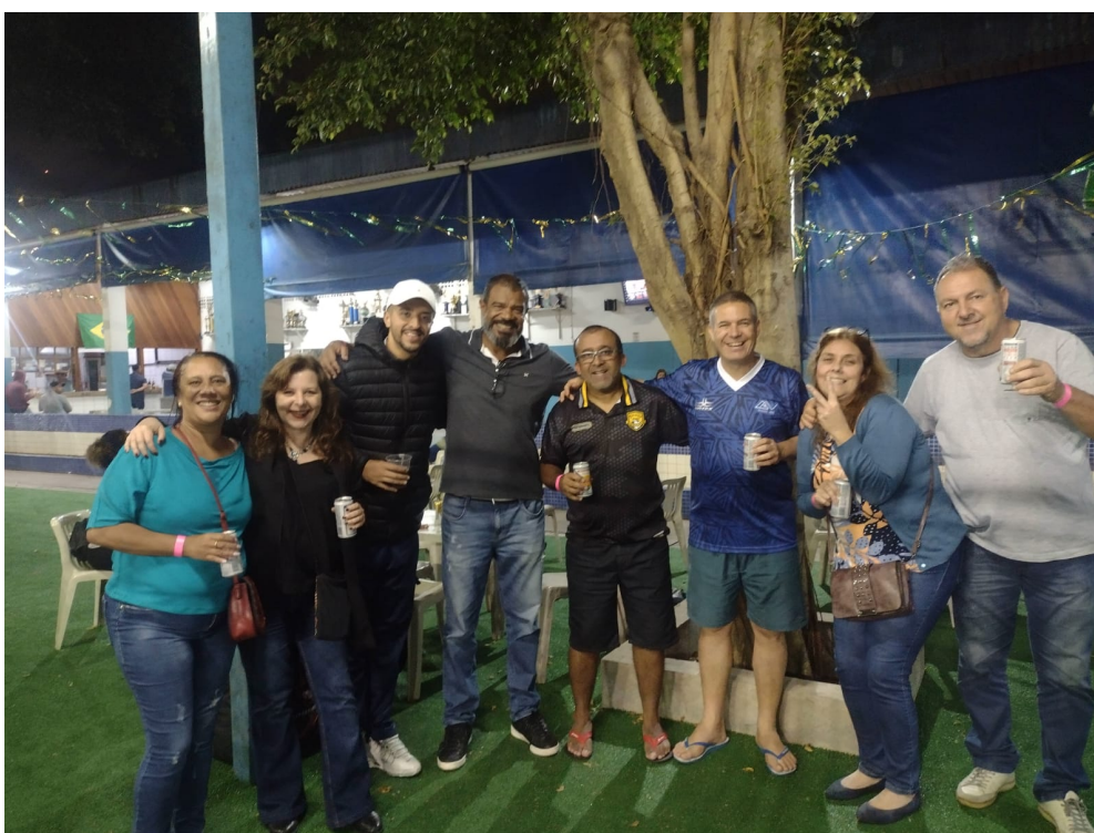
I – Festival Futsal das Estações/Primavera no Grêmio Guarapiranga, integrado à Diretoria da Associação na RMSP-Sul.