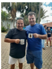
A Associação Sabesp do Departamento de Franca, integrado à Diretoria Regional UN Pardo e Grande, realizou em sua Sede-Clube, mais uma brilhante edição da 21ª Festa do Chopp.