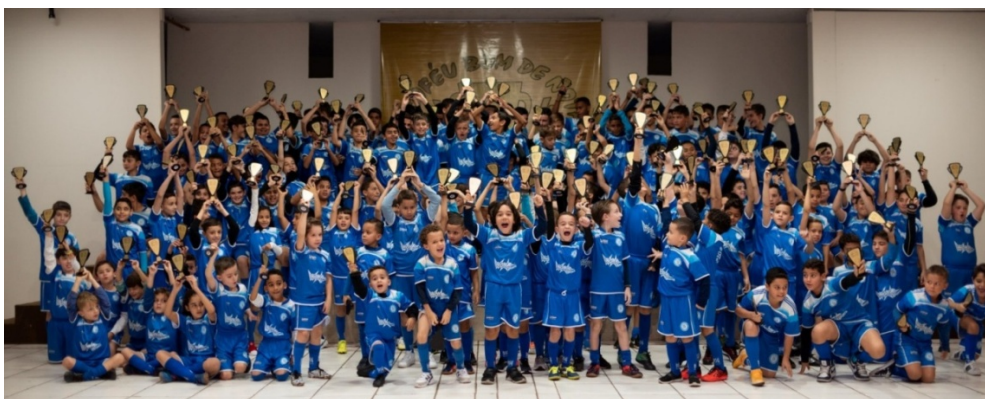
A 10ª edição do “Troféu Bom de Nota”, tradicional ação sócio-esportiva e cultural da Regional da Associação Sabesp, em Franca.