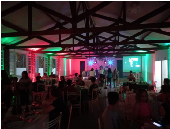
Noite da pizza em Tatuí, onde uma cantina italiana foi montada nesse evento da Diretoria Regional da Associação UN Médio Tietê.