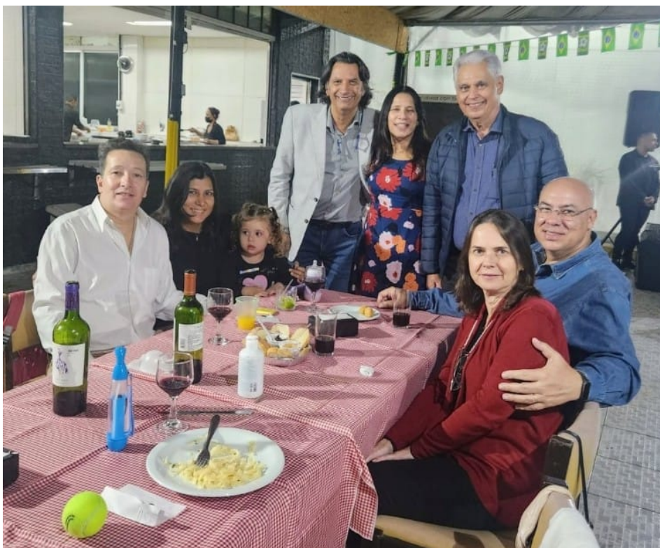
Noite Italiana, com Festival de Massas, na sede da 13 de Maio, mais um evento animado de Comemoração aos 50 Anos da Associação Sabesp – Jubileu de Ouro.