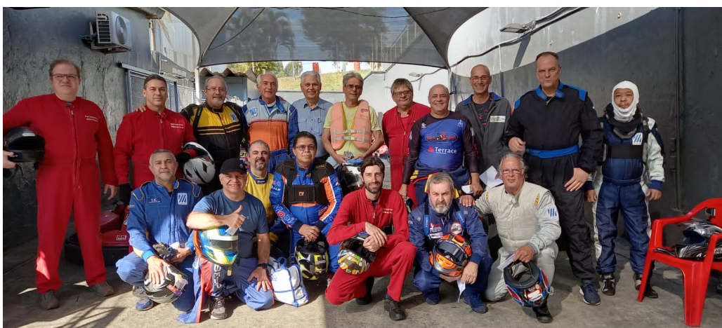
Celebração dos 50 anos da Associação Sabesp, com a equipe os pilotos “dinossauros” do KartSabesp, no Kartódromo da Aldeia da Serra, na Corrida do Jubileu de Ouro.