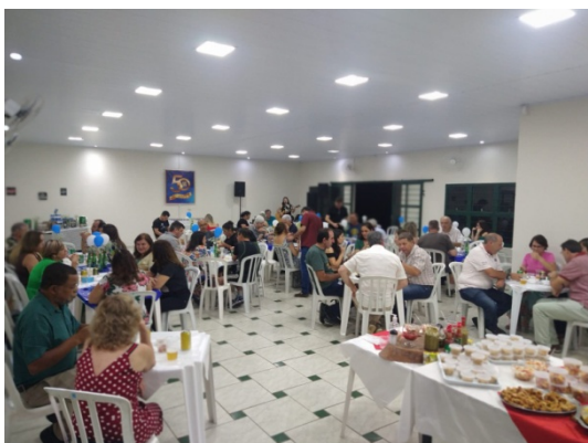
“Boteco dos 50 Anos”, no Grêmio de Botucatu, integrado à Diretoria Regional da Associação UN Médio Tietê.