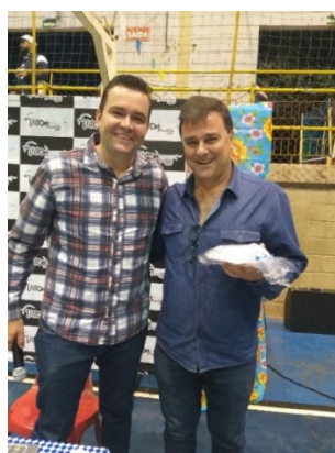
O tradicional “XXIV Arraiá da Água Ardente”, no Ginásio Cláudio